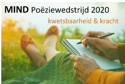
MIND Poëziewedstrijd 2020 kwetsbaarheid & kracht

Tijdens de eerste MIND Poëziewedstrijd twee jaar geleden kregen we zo veel mooie gedichten binnen en zo veel positieve reacties, dat we besloten hebben weer een wedstrijd uit te schrijven. Dit keer staan de thema's kwetsbaarheid en kracht centraal, in deze tijd van crisis als gevolg van de corona-pandemie zeer actueel. Wij willen graag een stem geven aan al die creatieve minds die er in ons land zijn! Dus ben jij gek op poëzie en schrijf je zelf ook wel eens een gedicht? Heb je inspiratie om over kwetsbaarheid of over kracht te dichten? Of over allebei, gecombineerd in één gedicht? Lees de voorwaarden en aanvullende info